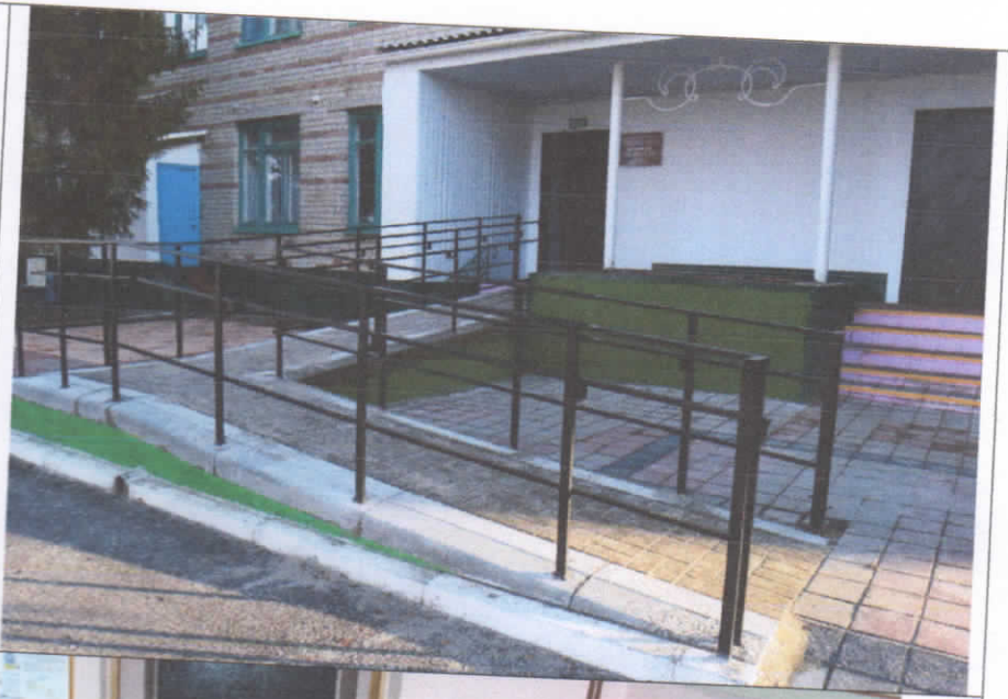
Фото движения по объекту